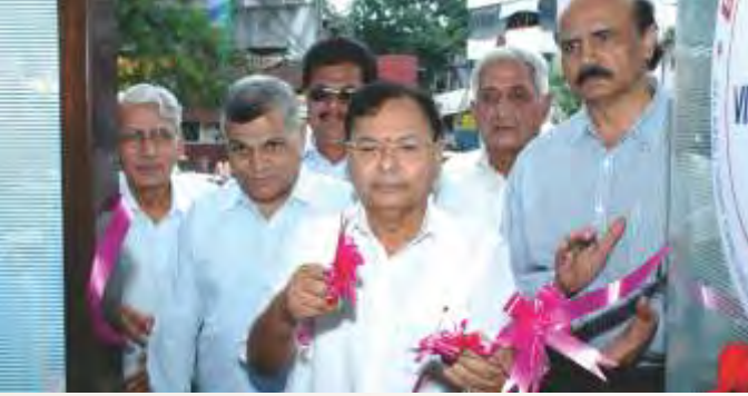
भवन शाखेचे एटीएम केंद्राचे उद्घाटन प्रसंगी आमदार मा. डॉ. पतंगराव कदम साहेब समवेत बँकेचे चेअरमन व व्हाईस चेअरमन व इतर मान्यवर