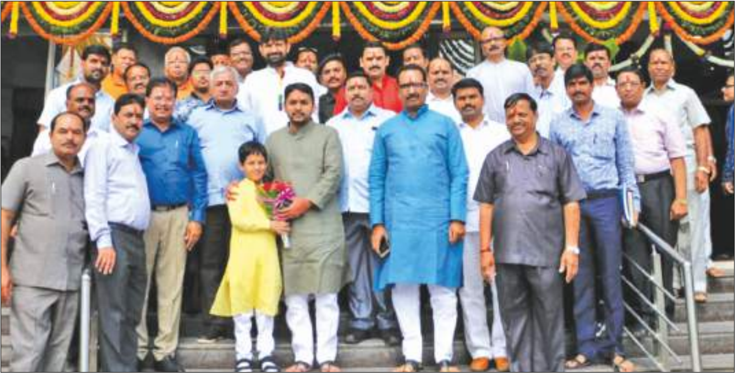
बँकेचे माजी अध्यक्ष तथा नामदार डॉ. विश्वजित कदम, सहकार, कृषी, सामाजिक न्याय, अन्न, नागरी पुरवठा व ग्राहक संरक्षण, अल्पसंख्यांक विकास व औकाफ, मराठी भाषा राज्यमंत्री, महाराष्ट्र राज्य यांची बँकेच्या भवन शाखेस सदिच्छा भेट.